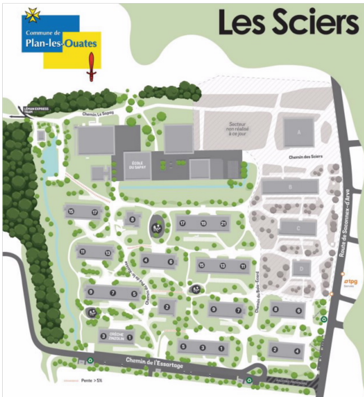
Carte du quartier avec en grisé les étapes non réalisées, la seconde étape correspond aux immeubles B, C et D. L'immeuble A sera réalisé ultérieurement.

Pour mémoire, ces bâtiments sont construits au cœur d'un parc selon le principe établi dans le cadre du PLQ adopté en 2015. Les espaces publics sont en réalité des espaces sous domanialité privée avec une servitude d'usage public.