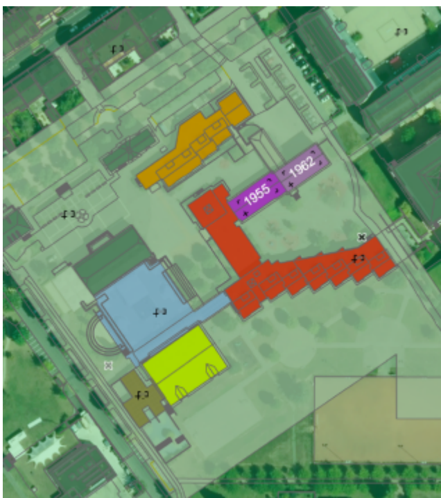
Localisation des affectations du complexe

Situé en plein cœur de Plan-les-Ouates, le groupe scolaire du Pré-du-Camp a été réalisé au fil du temps par différentes extensions pour répondre aux besoins croissants d'accueil de places scolaires sur le territoire. Le complexe du Pré-du-Camp est composé d'une école comprenant 3 bâtiments (Boymond, Pré-du-Camp CE et CM), d'une bibliothèque, d'un gymnase, d'une piscine et d'un bâtiment pour les activités du parascolaire.