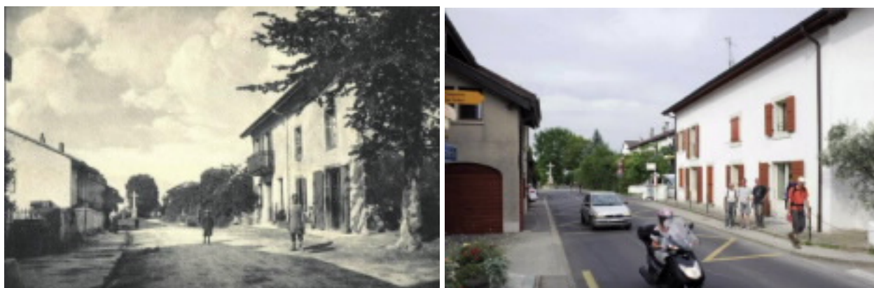
Figures 1 et 2 : centre du village de Saconnex-d'Arve Dessus il y a une centaine d'année et aujourd'hui.

Le village de Saconnex-d'Arve Dessus, sur le Coteau de Plan-les-Ouates, fait partie intégrante du patrimoine paysager et architectural de la Commune. Le cœur villageois, composé de nombreux bâtiments anciens datant du 19 e siècle et de maisons paysannes traditionnelles, côtoie des constructions plus récentes, un contraste architectural qui reflète l'évolution du village dans les dernières décennies.