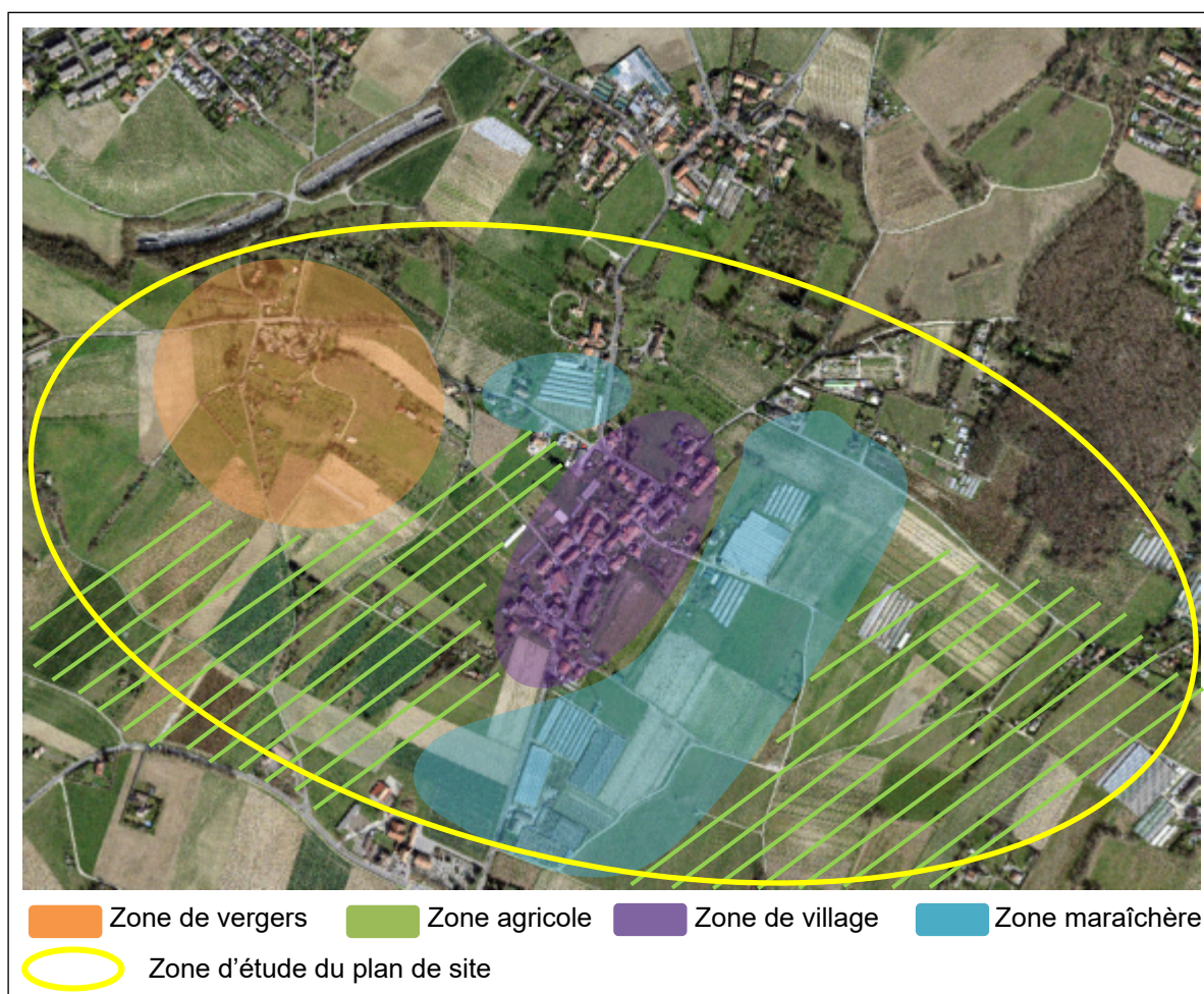
Figure 3 : périmètre d'étude pour le plan de site de Saconnex d'Arve-Dessus

Tout comme le reste du territoire rural, le secteur de Saconnex-d'Arve Dessus est aujourd'hui soumis à une forte pression foncière, comme l'atteste le récent développement des quartiers voisins de La Chapelle et des Sciers.