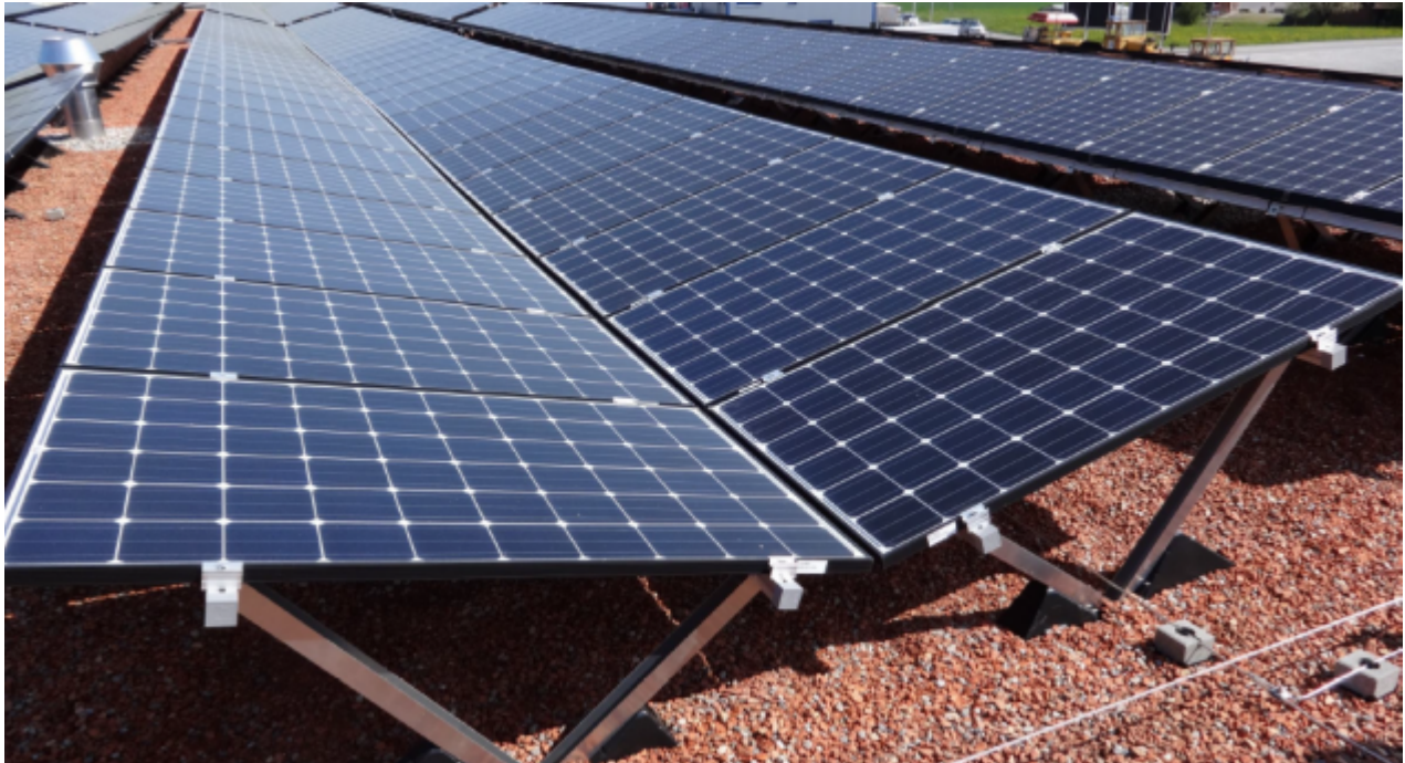
Photographie d'une mise en place de panneaux en V avec végétalisation par substrat (verdure à venir)

La partie basse du « V » est quasiment fermée et ne laisse passer que l'eau. Les côtés extérieurs sont suffisamment hauts pour éviter l'ombre des hautes herbes. Enfin, l'inclinaison des panneaux et l'orientation nord-sud des lignes permet une pénétration de la lumière sous les panneaux, le matin ou le soir.